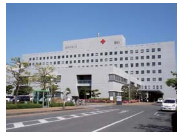
岡山赤十字病院まで 徒歩 6 分