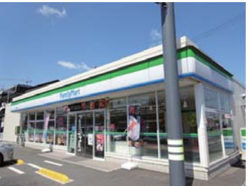
ファミリーマート 岡山青江店まで 徒歩 5 分