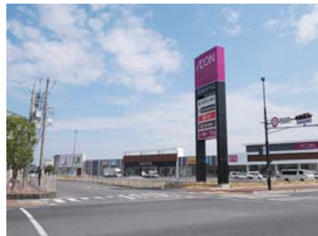
イオンスタイル 岡山青江まで 徒歩 3 分