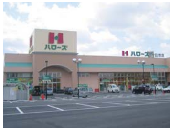
ハローズ十日市店まで 徒歩 12 分