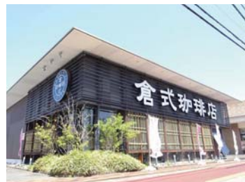
倉式珈琲店まで 徒歩 2 分