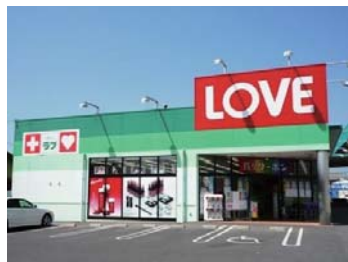
くすりのラブ 十日市店まで 徒歩 11 分