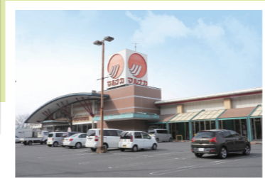
山陽マルナカまで徒歩22分