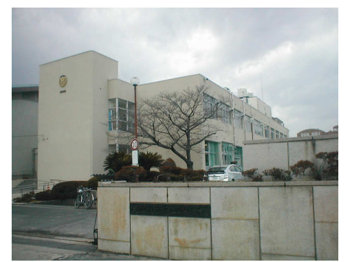
京山中学校 徒歩25分