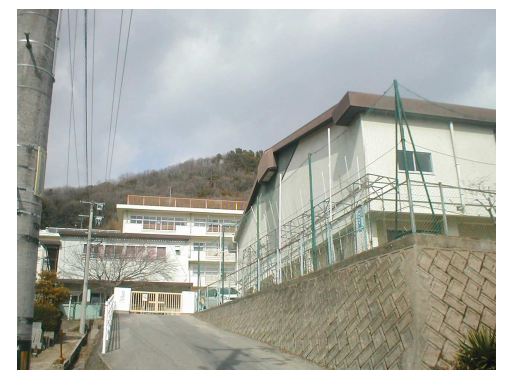
津島小学校 徒歩24分