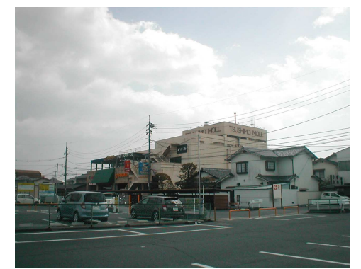
津島モール 徒歩4分