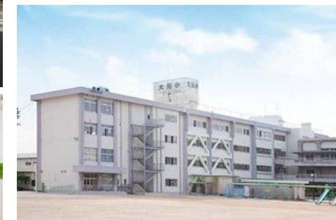
大元小学校 徒歩14分