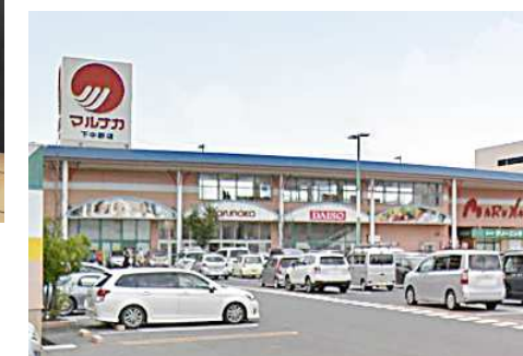
マルナカ下中野店 徒歩8分