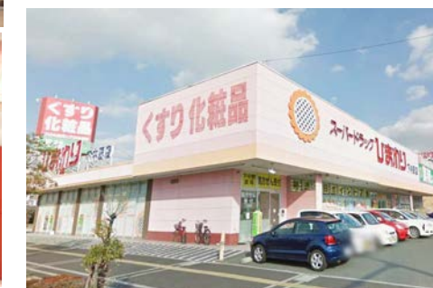
スーパードラッグひまわり 徒歩3分